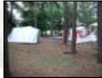
Zelten im Wald