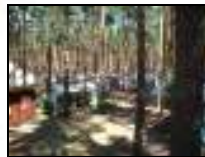
Camping im Grünen!