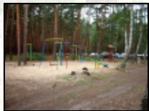
Spielplatz für die Kleinen...