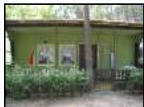
Mietbungalow für vier bis sechs Personen