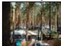
Camping in der Natur ist Erholung pur! ®