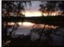
Die Schmöde am Morgen