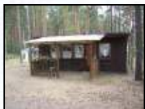
Mietbungalow für vier Personen