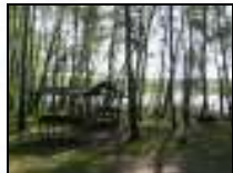
...direkt am Wasser