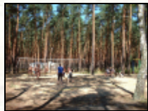
...und der Volleyballplatz für die Großen