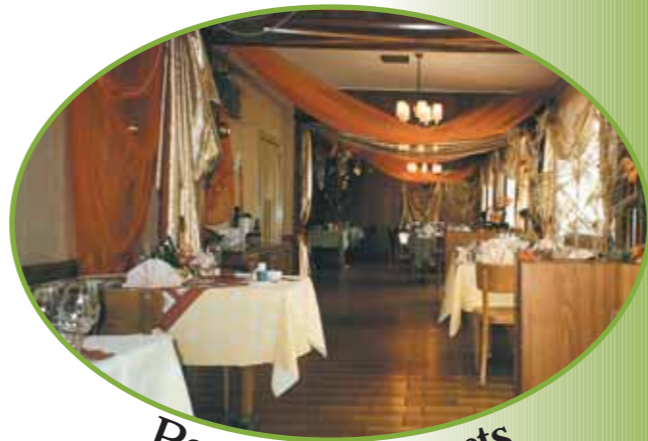
Pour vos banquets