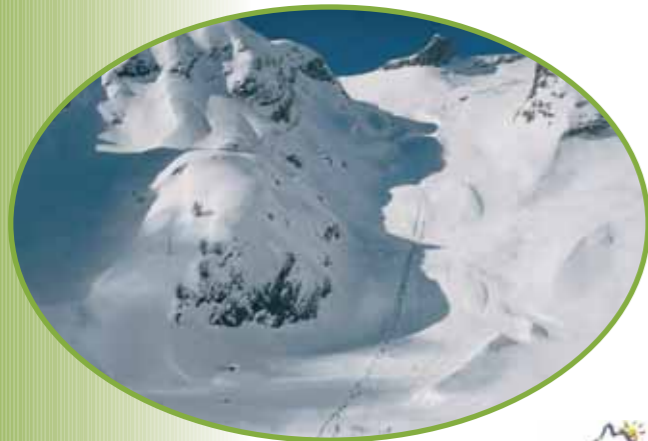
www.ovronnaz.ch (12 km)