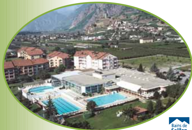
www.bainsdesaillon.ch (2 km)