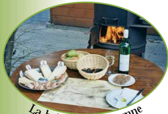
La brisolée en automne