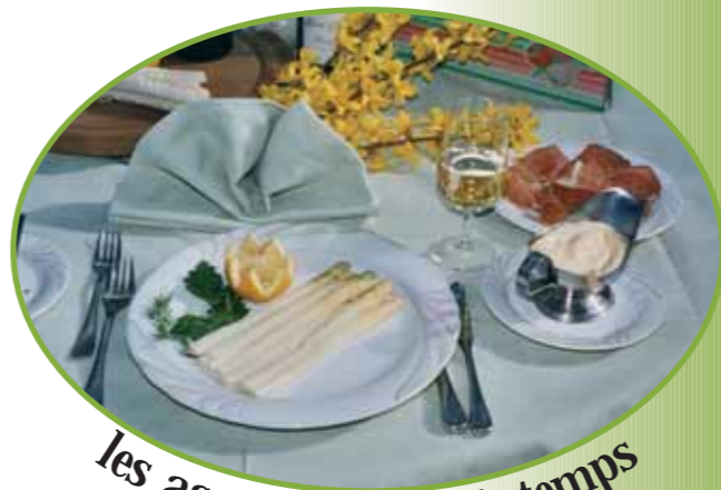
les asperges au printemps