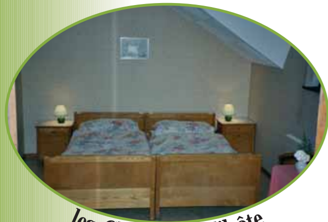
les Chambres d'hôte