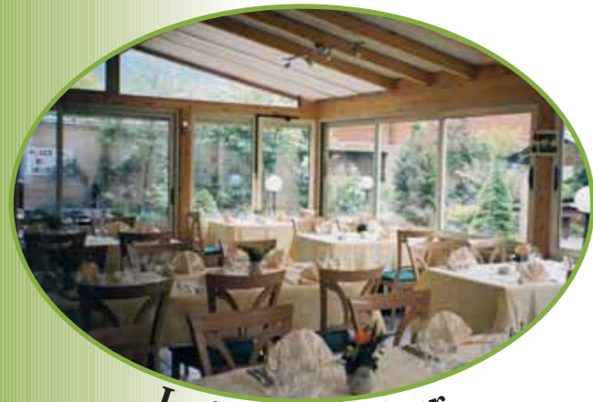
Le jardin d'hiver