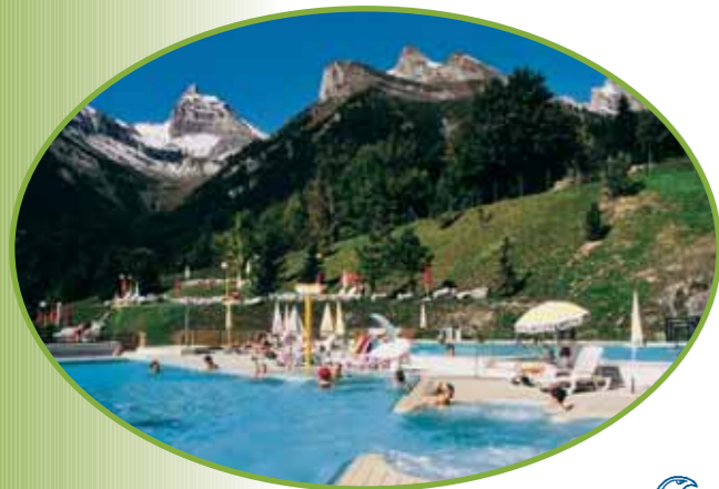
www.thermalp.ch (12 km)